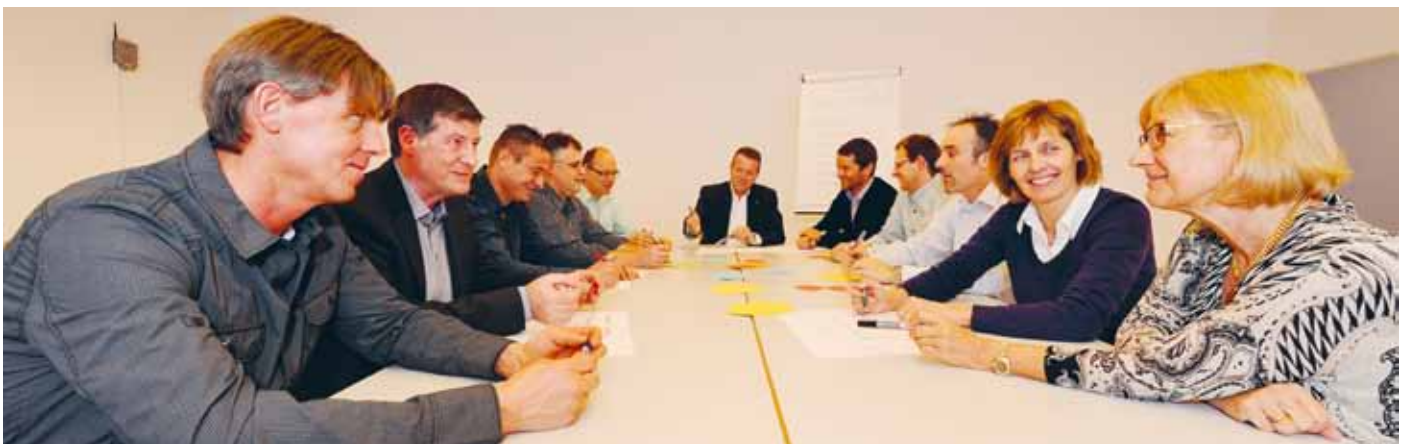
Das neue FBP-Gemeinderats-Team setzt sich mit Bürgermeister Ewald Ospelt für eine weiterhin gute Zukunft von Vaduz ein.