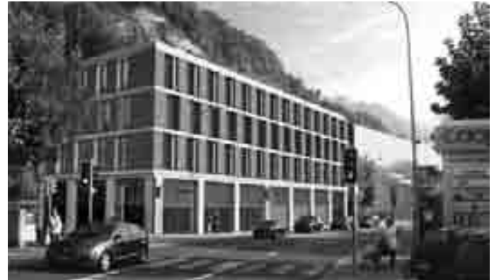
Die gezielt triste Darstellung der VU, ohne Geschäftsräumlichkeiten und Café