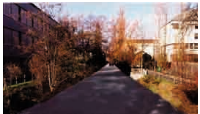
Eine reine Erfindung der VU ist die Zubetonierung des Giessens mit entsprechender Strassenführung.