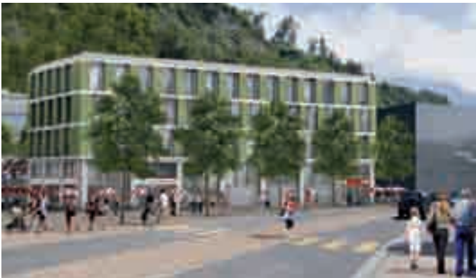
Eine realistische Darstellung des geplanten Vaduzer Verwaltungs- und Geschäftshauses: freundlich und einladend.

Im Zusammenhang mit dem geplanten Neubau des Verwaltungs- und Geschäftshauses, aber auch zu anderen Themen, haben die Kommunikatoren der VU gezielt Falschinformationen gestreut und sie im «Klartext» und im «Liechtensteiner Vaterland» entsprechend plakativ ins Bild gesetzt. Zu diesen Täuschungen zählen beispielsweise das «Verwaltungs- und Geschäftshaus», (Bild) der «Minigolf-Parkplatz» oder die frei erfundene Zubetonierung des Giessens. (Bild) VADUZMAGAZIN zeigt die Machenschaften der VU im Vergleich auf: