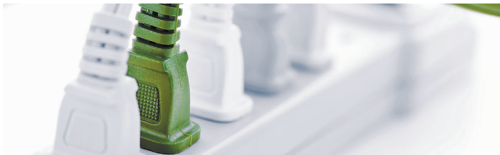
Energiepolitik im 6-Punkte-Programm: Der Energiemix muss optimal ausgestaltet werden und effizient dort ankommen, wo er benötigt wird.

Aeulestrasse 56, 9490 Vaduz Tel.: 237 79 40, Fax: 237 79 49 www.fbp.li