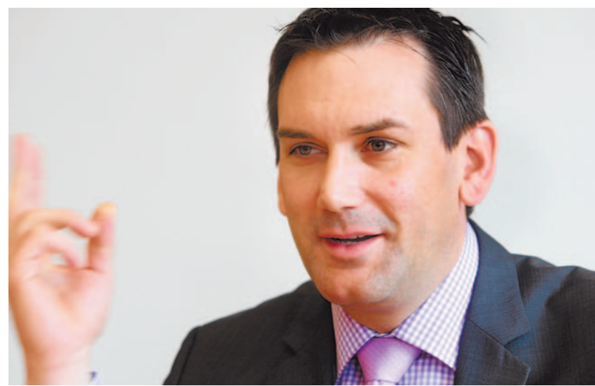
«Ich nehme Stimmen ernst, die vor den Auswüchsen von Geldspielen warnen.»

Richtig, aber nicht durch Einzelmassnahmen, sondern durch ein abgerundetes Paket von Massnahmen, die letztlich dazu führen, dass Liechtenstein zu einem attraktiven Tourismusland wird. Die Tourismuswirtschaft ist ein Wachstumsbereich, der in den letzten Jahren jedoch eine enorme Veränderung erlebt hat. Die Konsumenten haben eine klare Vorstellung dessen, was sie haben wollen, ob dies nun Wellness-Urlaub, das Kinderhotel, die Wintersportferien oder die Kulturreise ist. Eine schöne Landschaft, wie wir sie in Liechtenstein haben, ist eine gute Voraussetzung, reicht aber schon lange nicht mehr. Erfolg im Tourismus verlangt die Anpassung an den Wandel der touristischen Nachfrage und die Gegebenheiten des Marktes. Die Kenntnis wichtiger