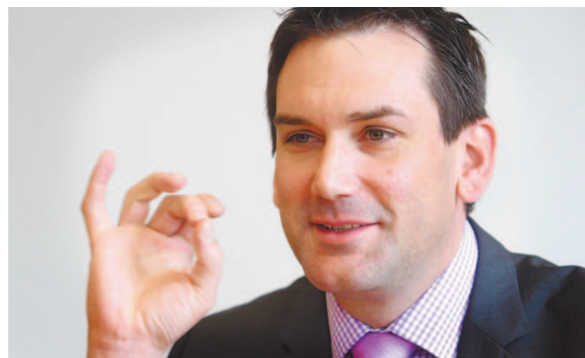
«Ich habe Zielsetzungen und diese Ziele möchte ich verwirklichen.»

Trends ist deshalb eine Voraussetzung für die erfolgreiche Produktentwicklung und Angebotsgestaltung. Wir haben deshalb eine Arbeitsgruppe damit beauftragt, Chancen und Szenarien einer qualitativen Hotelförderung sowie die Möglichkeiten für einen Kongress- und Seminar-tourismus zu evaluieren. Damit die richtigen Entscheidungen getroffen werden können, muss eine umfassende Analyse des Potenzials für einen Tourismus der Zukunft vorgenommen werden.